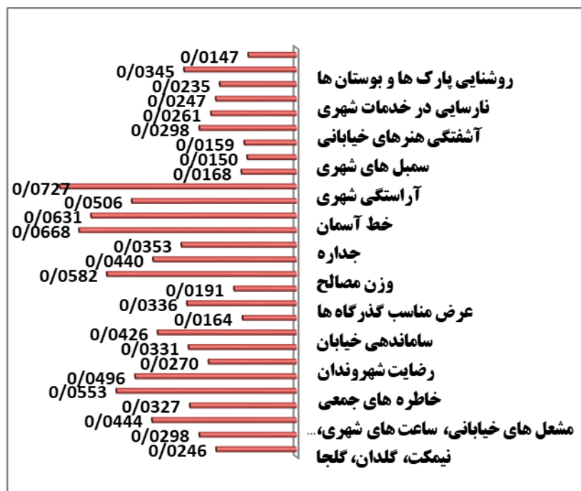
شکل ۳. اولویت بندی نهایی شاخص های تحقیق