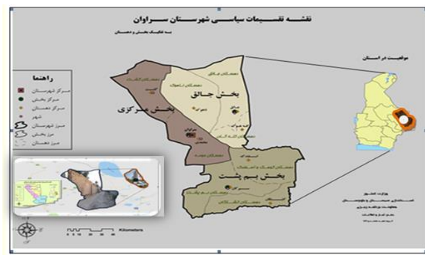
شکل ۱. نقشه موقعیت جغرافیایی محدوده مورد مطالعه

شهر سراوان ۲۳۸۸۰ کیلومتر مربع وسعت دارد. مساحت این شهرستان ۱۵/۲ درصد مساحت کل استان را تشکیل می‌دهد و در موقعیت ۶۲ و ۳۵ دقیقه عرض جغرافیایی واقع شده است. از شمال غرب به خاش، از غرب به سوران، از شرق و جنوب شرقی به کشور پاکستان و قسمتی از جنوب به شهرستان سرپاز محدود می‌شود. براساس سرشماری در سال ۱۳۹۵ جمعیت این شهر ۱۹۱ هزار و ۶۶۱ نفر شامل ۹۶ هزار و ۵۸۹ نفر مرد و ۹۵ هزار و ۷۲ نفر زن بوده است. آب شرب این شهرستان از طریق ۱۲۶۹ حلقه چاه ۳۰۷ رشته قنات ۲۷۲ رشته چشمه با میزان آبدی ۱۸۳ میلیون مترمکعب و رودخانه‌های ماشکید با میزان آبدی متوسط سالانه ۸۰ میلیون مترمکعب تأمین می‌شود. شهر سراوان دارای اقلیم بیابانی گرم و خشک می‌باشد. میانگین بارش سالانه در این شهرستان ۱۰۴/۶ میلی‌متر و متوسط دمای آن از ۴۳ الی ۴- درجه‌ی سانتی‌گراد در تغییر است. مردم شهر سراوان به زبان بلوچی تکلم می‌کنند و زبان فارسی نیز رایج است. میزان باسوادی شهرستان در سال ۸۲، ۶۹/۱ درصد بوده است.