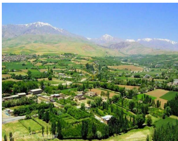
شکل ۵. تغییر چشم انداز روستا شهر گلدشت بر اثر ساخت خانه‌های دوم، مأخذ (نگارندگان: ۱۴۰۲)