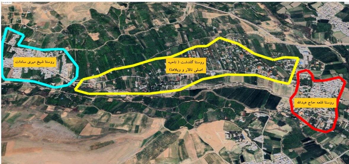
شکل ۴. منطقه روستا شهری گلدشت در سال ۱۴۰۲