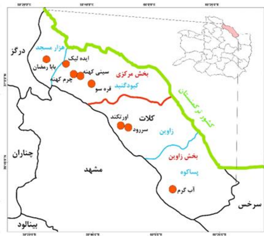
شکل ۲. نقشه موقعیت روستاهای نمونه در شهرستان کلات استان خراسان رضوی

محدوده مورد مطالعه شهرستان کلات نادری در استان خراسان رضوی است. این شهرستان دارای ۲ بخش مرکزی و زاوین و ۴ دهستان پساکوه، زاوین، کیود گنبد و هزار مسجد است. مطابق شکل (۲)، ۸ روستای مقصد گردشگری مورد مطالعه در ۴ دهستان این شهرستان پراکنده می‌باشند.