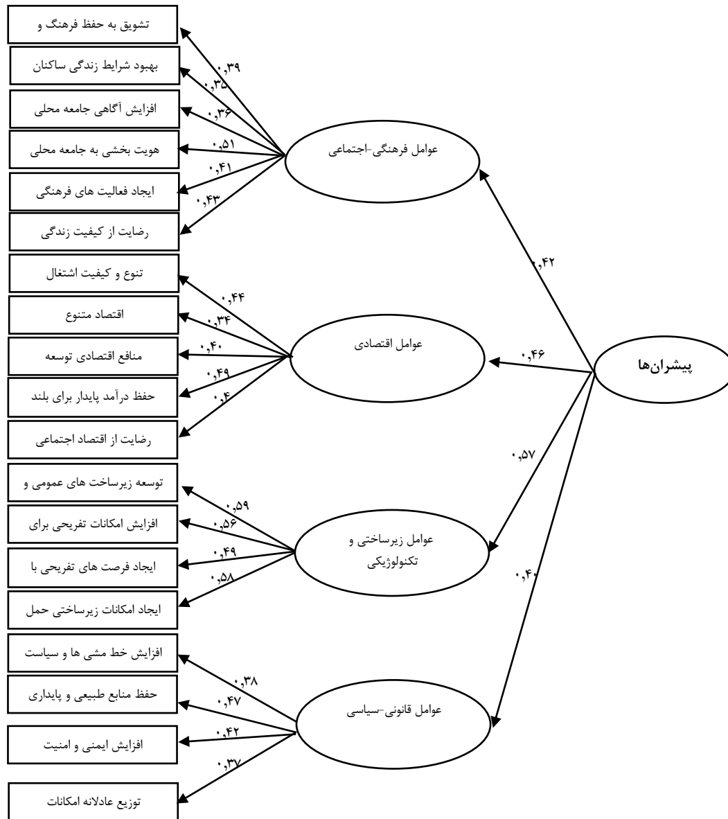
شکل ۳. مدل تحلیل مسیر متغیرهای پژوهش (مضامین)

همان‌طور که در دیاگرام‌های فوق مشاهده می‌شود، تمامی مضامین مقادیری بالاتر از حد قابل قبول را کسب کرده‌اند و تناسب مضامین (شاخص‌های) مدل حاکی از مناسب بودن مدل اندازه‌گیری است که از میان مضامین فراگیر، مضمون "عوامل زیرساختی و تکنولوژیکی" و از میان مضامین سازمان دهنده، مضمون "توسعه زیرساخت‌های عمومی و بهداشتی، ایجاد امکانات زیرساختی حمل‌ونقل، هویت بخشی به جامعه محلی، افزایش امکانات تفریحی برای جامعه محلی، هویت بخشی به جامعه محلی، حفظ درآمد پایدار برای بلندمدت" به ترتیب با مقادیر ۰,۵۹، ۰,۵۸، ۰,۵۶، ۰,۵۱ و ۰,۴۹ بیشترین تأثیر را دارند. در جدول ۳، اولویت هر یک از پیشران‌های کلیدی و مؤثر در این زمینه انجام شده است.