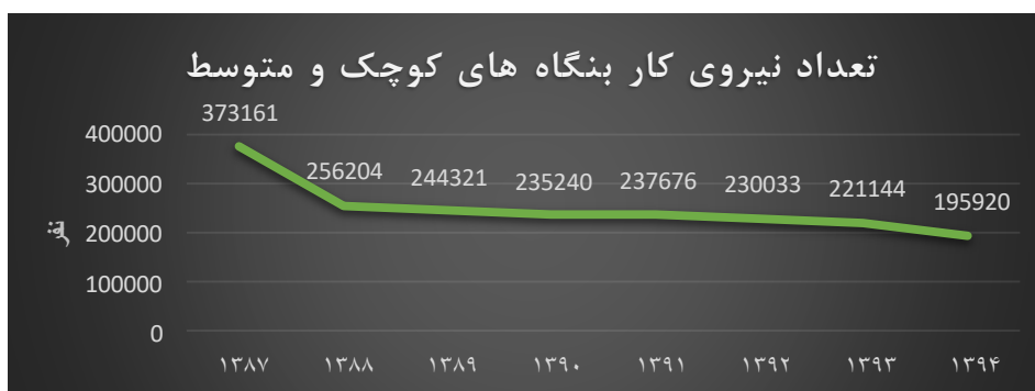
شکل ۲. نمودار تعداد نیروی کار بنگاه‌های کوچک و متوسط

افزایش نسبت به سال ماقبل خود فعالیت نموده است. همان‌گونه که در شکل (۲) نشان داده شده است تعداد نیروی کار در سال ۱۳۸۷، ۲۷۳،۱۶۱ نفر بوده است که این تعداد در پایان سال ۱۳۹۴ به عدد ۱۹۵،۹۲۰ نفر رسیده است که این به معنای فعالیت حدود ۷۲ درصد از آنان در سال ۱۳۹۴ می‌باشد. این روند از یک طرف روند کاهشی تولید در بنگاه‌های کوچک و متوسط را نشان می‌دهد و از طرف دیگر بیان‌گر تأثیرپذیری زیاد این بخش از نوسانات اقتصادی می‌باشد که با افزایش سطح تحریم‌ها و روند صعودی نرخ ارز و به تبع آن تورم و عملاً عرصه فعالیت بر این بنگاه‌ها تنگ شده و موقعیت فعالیت خود را از دست می‌دهند. به عبارت دیگر بنگاه‌های کوچک و متوسط با نرخ تورم افزایشی طی این سال‌ها عملاً توان مقابله با افزایش قیمت را نداشته و به دلیل پشتوانه ضعیف آن‌ها کم‌کم از گردونه تولید خارج می‌شوند و بنگاه‌ها به تعدیل نیروهای خود می‌پردازند.