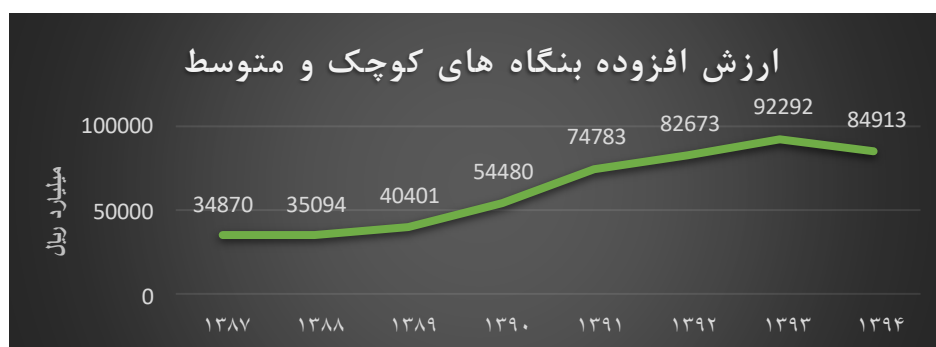
شکل ۱. نمودار ارزش افزوده بنگاه‌های کوچک و متوسط

ارزش افزوده کسب و کارهای کوچک و متوسط همانطور که در شکل (۱) ملاحظه می‌شود دارای روند صعودی از سال ۱۳۸۷ تا سال ۱۳۹۳ می‌باشد و تنها در سال ۱۳۹۴ به دلیل نرخ تورم و سایر نوسانات بازار کالا کاهش یافته است. به بیان دیگر می‌توان این گونه گفت که در تمامی سال‌های مورد بررسی روند ارزش افزوده، روندی صعودی بوده و تنها در سال آخر به دلیل تضعیف توان بنگاه‌های کوچک و متوسط دارای ارزش افزوده کاهشی بوده‌اند. ارزش افزوده در سال ۱۳۸۷ با رقم ۳۴,۸۷۰ میلیارد ریال شروع و تا سال ۱۳۹۳ حدود سه برابر و به رقم ۹۲,۲۹۲ میلیارد ریال رسیده است و با کاهش در سال ۱۳۹۴ به رقم ۸۴,۹۱۳ میلیارد ریال رسیده است.