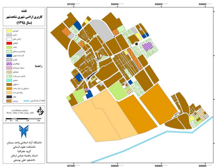
شکل شماره (۲) نقشه کاربری اراضی شاهد شهر در سال ۱۳۹۵