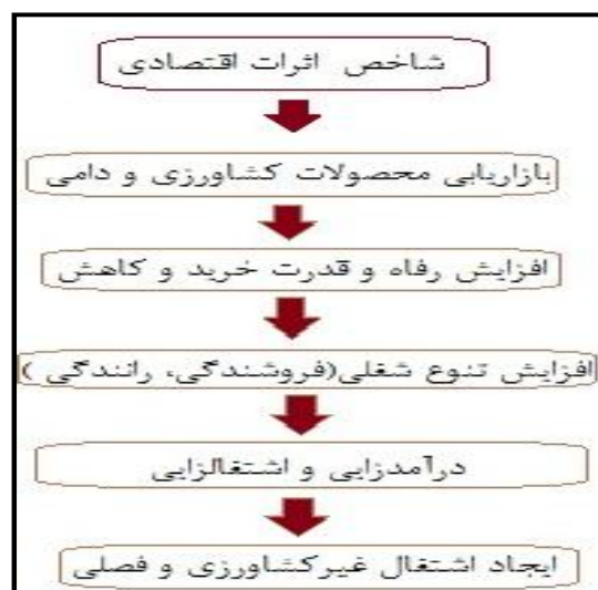
شکل شماره (۱): مدل مفهومی اثرات اقتصادی شهرک صنعتی آق قلا

صنعتی‌سازی نواحی روستایی باشد (دریان‌آستانه، ۱۳۸۳: ۷۷). نواحی صنعتی موجب افزایش درآمد روستاییان و کاهش اختلاف درآمد بین شهرنشینان و روستاییان گردیده (Sunder, 2009: 28-29) و میان آن‌ها پیوند ایجاد می‌کند؛ همچنین صنایع روستایی به تحکیم الگوی عدم تمرکز صنایع می‌انجامد (Walker, 2007: 3). با توجه به رشد بالای جمعیت و محدودیت زمین کشاورزی، صنایع روستایی می‌تواند با ایجاد فرصت‌های شغلی جدید نسبت قابل قبولی از نیروی کار را جذب نموده و آهنگ رشد نرخ بیکاری را کاهش دهد و زمینه را برای توسعه روستاها هموارتر سازد (Maran, 2007: 86). صنعت علاوه بر افزایش نرخ اشتغال، به‌عنوان یکی از بخش‌های غیرکشاورزی، منجر به افزایش درآمدهای غیرمحل‌ی گردیده و به صورت مستقیم و غیرمستقیم در مدرنیزاسیون بخش کشاورزی نیز نقش عمده‌ای دارد (Das, 2009: 1). صنعتی‌سازی روستاها منجر به تحول در اقتصاد روستایی گردیده و با جذب قسمتی از جمعیت روستا، تا حدی مشکل بیکاری را مرتفع نموده است (Sunder, 2009: 29)؛ همچنین با برقراری پیوند با کشاورزی، موجبات رشد آن را فراهم می‌آورد (Hwa, 1989: 45). به همین دلیل صنعتی شدن جایگاه مهمی در راهبردها و سیاست‌های کشورهای در حال توسعه دارد (Dutta, 2004: 334). استقرار صنایع در روستا قادر است فرصت‌های شغلی و درآمدی بیشتر ایجاد کند و از این رو بستر مناسبی برای توسعه روستایی به‌شمار می‌آید (حاجی‌نژاد، ۱۳۸۵: ۲۰).