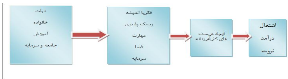
شکل شماره (۱): روند کارآفرینی یا اکوسیستم کارآفرینی

واژه کارآفرینی از کلمه فرانسوی Entrepreneur به معنای متعهد شدن نشأت گرفته است. بنابر تعریف واژنامه دانشگاهی وبستر، کارآفرین کسی است که متعهد می‌شود مخاطره‌های یک فعالیت اقتصادی را سازماندهی، اداره و تقبل کند (احمدپورداریانی، ۱۳۸۷: ۴). عمل کارآفرینی اشاره به کشف، ارزیابی و بهره‌برداری از فرصت‌ها (Shane et al., 2000: 219) و شناسایی فرصت‌های قابل دوام و پایدار است (Martin et al., 2010: 482) و می‌توان آن را معادل نوآوری تعریف کرد (Lauwere et al, 2002: 3) که باعث ایجاد هیجان و انگیزه و همچنین رشد و پیشرفت اقتصادی می‌شود (Pablo Couyoumdjian, 2012: 158). کارآفرینی باعث خلق نوآوری و قبول مخاطرات و منافع آن است (Hisrich et al., 2005: 8). در شکل ۱ روند شکل‌یابی کارآفرینی و ثمرات آن نشان داده شده است.