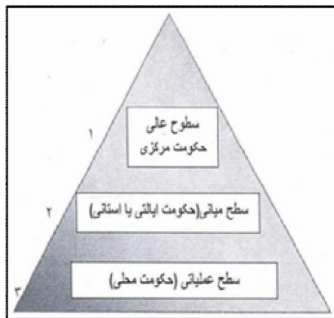
شکل شماره (۲): حوزه عملکرد شوراهای ایران (نصر، همان)