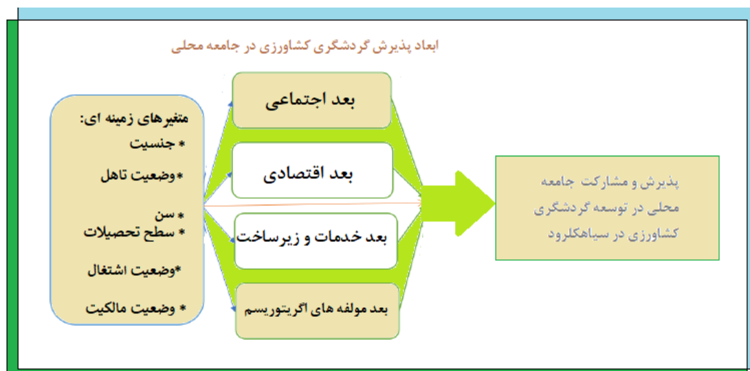
شکل ۱. شاخص های پژوهش

شفریل ۱ و همکاران (۲۰۱۴)، در پژوهشی با موضوع درک جامعه ساحلی از تأثیرات اجتماعی-اقتصادی فعالیت های آگروتوریسم در روستاهای ساحلی مالزی: به بررسی تأثیرات اجتماعی-اقتصادی فعالیت های آگروتوریسم در روستاهای ساحلی نمونه به عنوان دهکده چشم انداز ماهیگیری (DWN) در مالزی می پردازد. با این حال، تمرکز این مطالعات اخیر بیشتر بر گردشگران و چالش های انجام فعالیت های آگروتوریسم بوده است و در نتیجه به تأثیرات اجتماعی و اقتصادی توجه کمتری شده است. در مجموع و براساس چهارچوب نظری پژوهش مشخص شد که متغیرهای زمینه ای و ابعاد موثر بر توسعه گردشگری کشاورزی به شرح شکل ۱ می باشند.