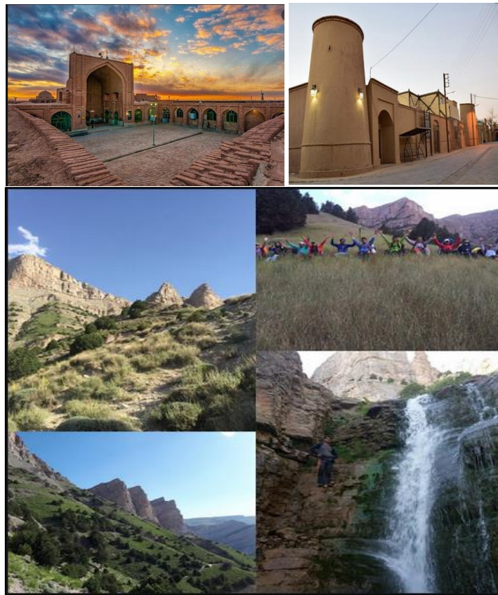
شکل ۲. مهم‌ترین جاذبه‌های گردشگری خراسان رضوی

روستای معدن در شهرستان فیروزه و همچنین روستاهایی مانند بزنگان با جاذبه‌های زمین‌شناسی (غار و اشکال زمین‌شناسی) در شهرستان سرخس اشاره داشت.