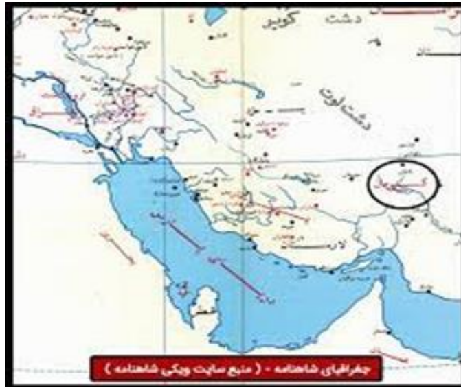
شکل ۲. نقشه موقعیت جغرافیایی محدوده مورد مطالعه

دارای رتبه اول می‌باشد. بارش سالانه در استان حدود ۱۱۰ میلی متر است. تنوع آب و هوایی بالا در استان کرمان باعث شده است که این استان دارای محصولات کشاورزی متنوع شامل محصولات گرمسیری و نیمه گرمسیری و درختان میوه مناطق سردسیری باشد.