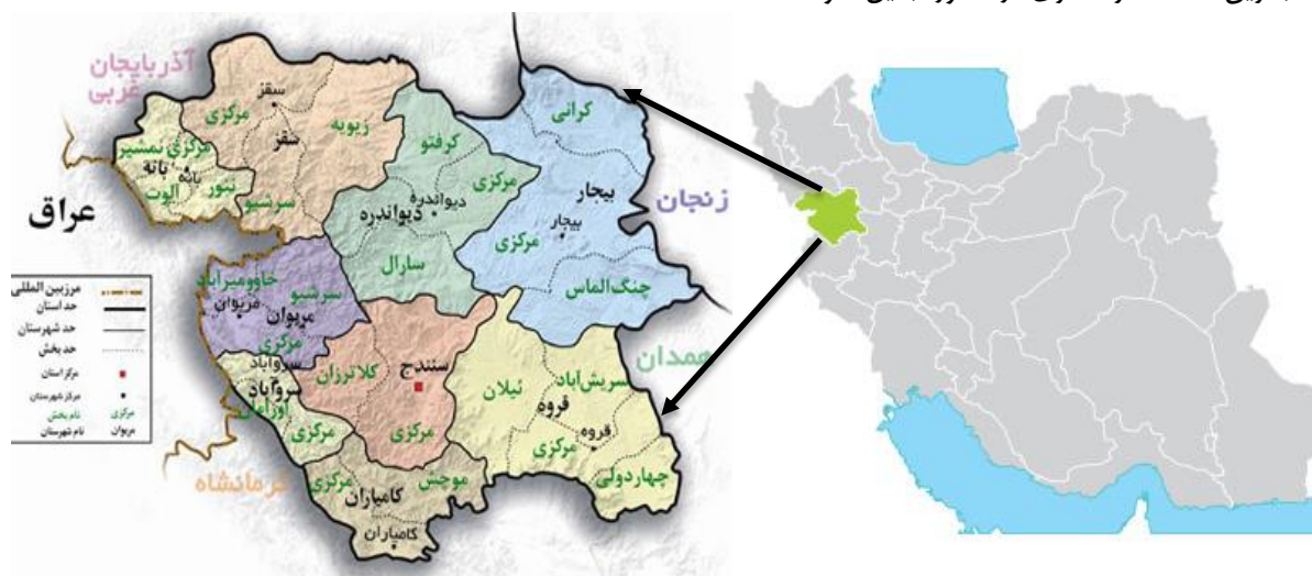
شکل ۲. موقعیت جغرافیایی محدوده مطالعاتی

استان کردستان یکی از استان‌های ایران به مرکزیت شهر سنندج است که در غرب کشور واقع شده است. مساحت این استان ۲۸۲۰۰ کیلومتر مربع معادل ۱/۷ درصد مساحت کل کشور ایران است. این استان که در دامنه‌ها و دشتهای پراکنده سلسله جبال زاگرس میانی قرار گرفته است، از شمال به استان‌های آذربایجان غربی و زنجان، از شرق به همدان و زنجان، از جنوب به استان کرمانشاه و از غرب به اقلیم کردستان و کشور عراق محدود است. استان کردستان با کشور عراق ۲۰۰ کیلومتر مرز مشترک دارد. استان کردستان براساس آخرین تقسیمات کشوری در سال ۱۳۹۰ دارای ۱۰ شهرستان، ۲۹ شهر، ۳۱ بخش، ۸۶ دهستان و ۱۶۹۷ آبادی دارای سکنه و ۱۸۷ آبادی خالی از سکنه بوده است. شهرستان‌های این استان عبارتند از: مریوان، بیجار، دهگلان، دیواندره، سروآباد، سقز، سنندج، قروه، کامیاران و بانه. بر پایه سرشماری عمومی نفوس و مسکن سال ۱۳۹۵ استان کردستان ۱۶۰۳۰۱۱ نفر جمعیت دارد که ۶۶ درصد شهری و ۳۴ درصد را جمعیت روستایی تشکیل می‌دهد. تراکم نسبی جمعیت معادل ۲/۵۱ نفر در کیلومتر مربع است. موقعیت جغرافیایی استان کردستان، آب‌وهوای مطبوع و طبیعی، وجود تفرجگاه‌های جنگلی، آبشارهای فصلی، صنایع دستی و سوغات محلی، مجاورت در مرز اقلیم کردستان عراق و وجود کالاهای خارجی ارزان قیمت، این استان را به یکی از جذاب‌ترین مقاصد گردشگری در کشور تبدیل نموده است.