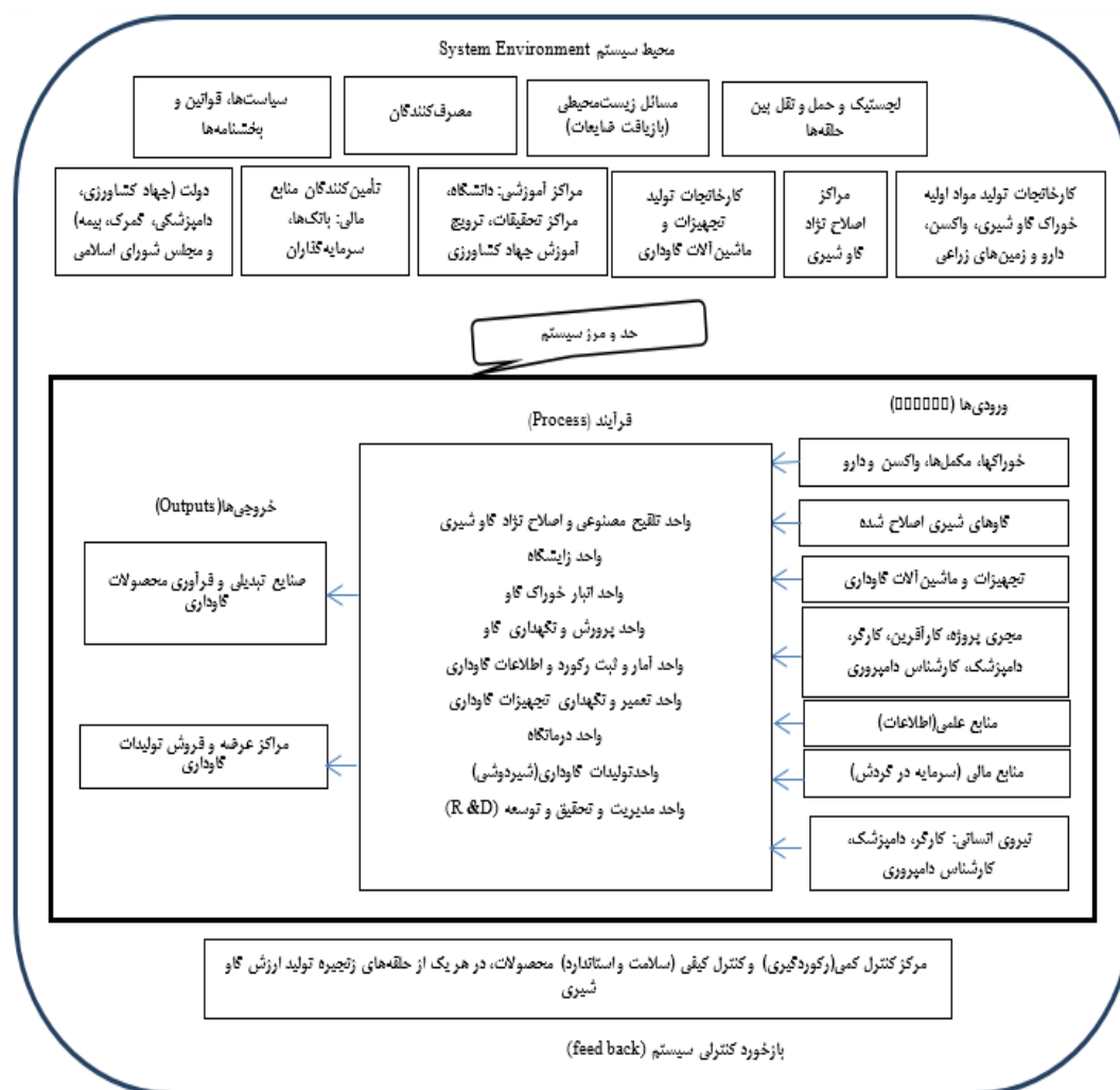
شکل ۱. مدل مفهومی تحقیق