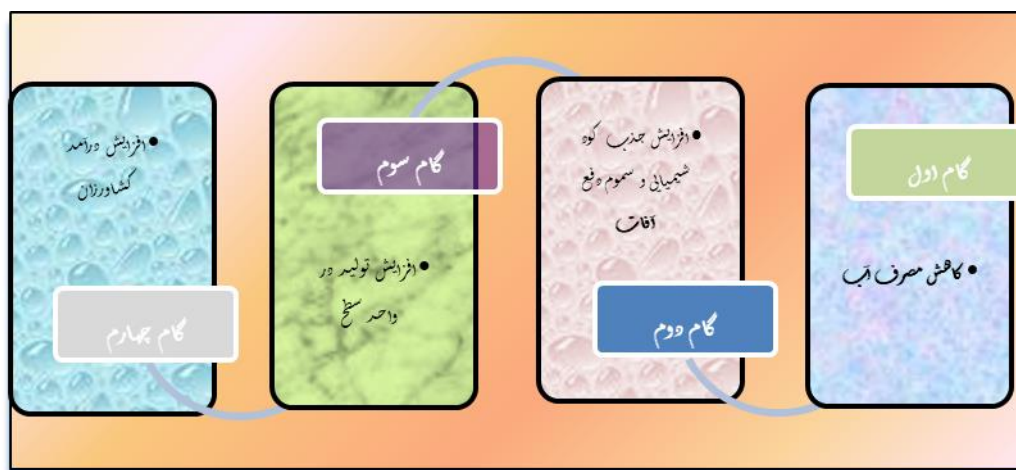
شکل ۳. اثرات کشت هیدروپونیک

الگوریتم خوشه‌ای کردن روستاها به منظور ظرفیت‌سنجی کشت هیدروپونیک با روش تحلیل خوشه-ای