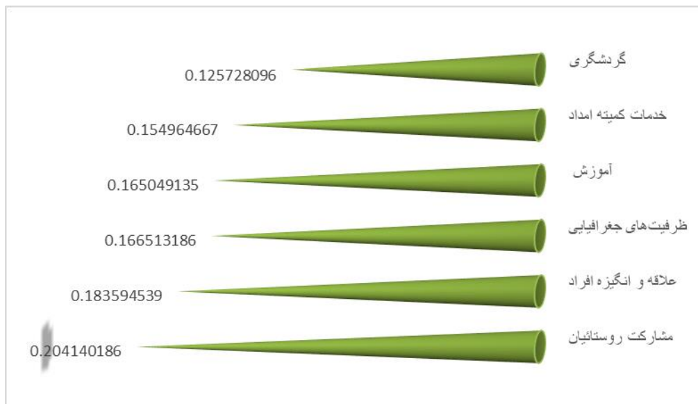
شکل ۳. نمودار وزن شاخص‌های توانمندسازی با استفاده از تکنیک دیمتل

با توجه به نتیجه نهایی تکنیک دیمتل، شاخص مشارکت روستائیان بالاترین امتیاز را به‌دست آورده‌است؛ پس از آن شاخص‌های علاقه و انگیزه افراد، ظرفیت‌های جغرافیایی، آموزش، خدمات کمیته امداد و گردشگری قرار می‌گیرند (شکل ۳).