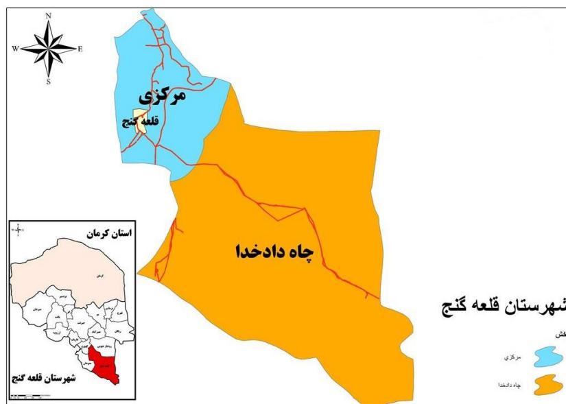
شکل ۱. نقشه موقعیت جغرافیایی محدوده مورد مطالعه

شهرستان قلعه گنج بین ۲۷ درجه عرضی و ۵۷ درجه طول جغرافیایی قرار گرفته است، از شمال به شهرستان کهنوچ، از جنوب به بندر جاسک، از جنوب شرق به استان سیستان و بلوچستان ( شهرستان های ایرانشهر و نیک شهر )، از شرق به شهرستان رودبار از غرب به منوجان محدود می‌شود. مساحت شهرستان ۱۴۲۰۰ کیلومتر مربع معادل ۳/۳ درصد از کل مساحت استان است و فاصله تا مرکز استان ۴۲۰ کیلومتر است. شهرستان قلعه گنج دارای ۲ بخش مرکزی و چاه دادخدا و ۵ دهستان به نامان دهستان رمشک، مارز، چاه دادخدا، قلعه گنج و سرخ قلعه است.