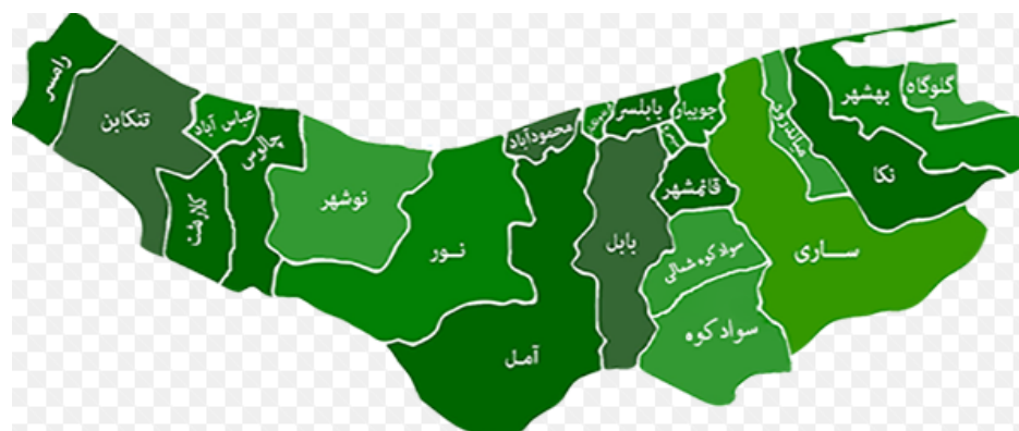
شکل شماره (۲) موقعیت شهرستان قائم شهر در استان مازندران

شهرستان قائم‌شهر در ۲۶ درجه و ۲۱ دقیقه تا ۳۶ درجه و ۳۸ دقیقه شمالی و ۵۲ درجه و ۴۳ دقیقه تا ۵۳ درجه و ۳ دقیقه طول شرقی از نصف النهار گرینویچ قرار گرفته است. این شهرستان ۴۵۸۵ کیلومتر مربع وسعت دارد. شهرستان قائم‌شهر از شمال به شهرستان جویبار، از جنوب به شهرستان سوادکوه، از شرق به شهرستان ساری و از غرب به شهرستان بابل محدود می‌شود. شهرستان قائم‌شهر دارای ۲ شهر، ۲ بخش، ۶ دهستان، ۱۵۶ آبادی دارای سکنه و ۳ آبادی خالی از سکنه است (استاندارداری استان مازندران، ۱۳۹۴). نقشه شماره ۱ موقعیت شهرستان قائم شهر را در استان مازندران نشان می‌دهد.