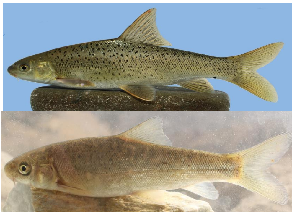
شکل ۱- نمایی جانبی از دو گونه سیاه‌ماهی، بالا: Paracapoeta trutta و پایین: Capoeta damascina رودخانه سیروان Fig 1. The lateral view of Paracapoeta trutta (upper) and Capoeta damascina (below) from Srirvan River