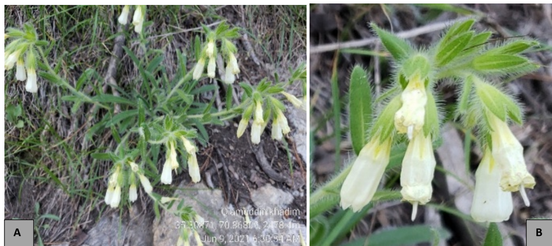
شکل ۲- ظاهر کلی از O. nuristanica A-B. زیستگاه و نمای نزدیک از گل آذین در طبیعت (عکس گرفته شده توسط ع. سلطانی احمدزی در محل). Figure 2. The general appearance of O. nuristanica . A-B. The habit and close-up view of the inflorescence in nature (Photographed by A. Sultani Ahmadzai in the type locality).