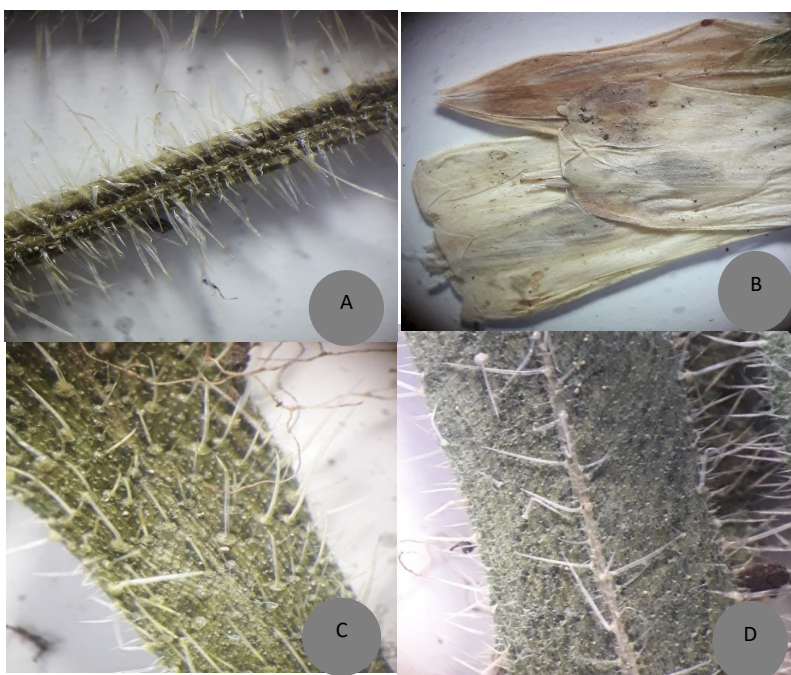
شکل ۴- استریو-میکروگراف پوشش کرک از O. nuristanica : A. ساقه، B. جام گل، C. سطح بالای برگ، D. سطح پایینی برگ.