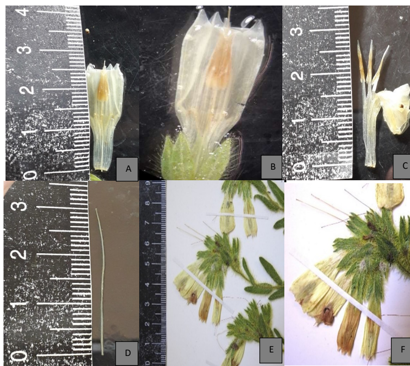
شکل ۵- استریو-میکروگراف جام گل از O. nuristanica : A. جام گل، B. جام گل با کاسه گل، C. پرچم ها، D. مادگی، E-F. بخشی از گل آذین در نمونه هرباریوم (FUMH-47620).