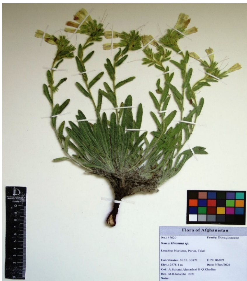
شکل ۳- نمونه O. nuristanica در هرباریوم FUMH (۴۷۶۲۰). Figure 3. The specimen of O. nuristanica in the herbarium of FUMH (47620).