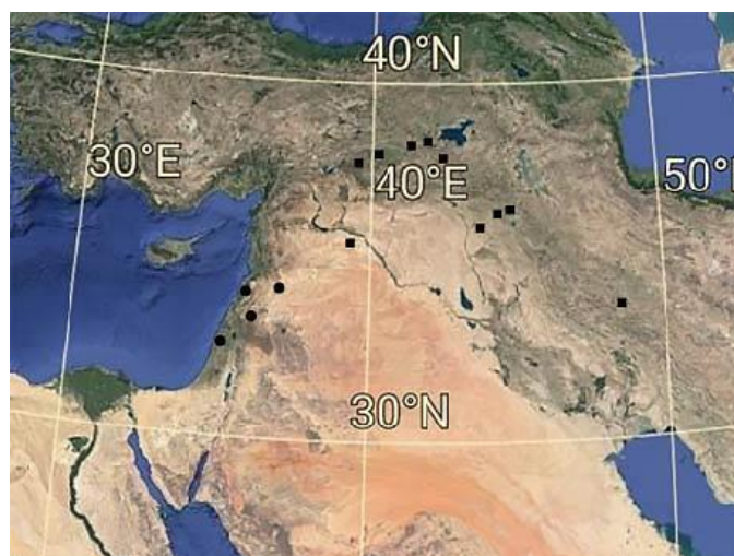
شکل ۳- پراکنش گونه‌های S. melampyroides (■) و S. neurocalycina (●). Figure 3. Distribution of S. melampyroides (■) and S. neurocalycina (●).

Satureoides شناخته نشد اما در کنار گروه قاعده‌ای تبارشاخه Satureoides+Fragilicaulis به‌عنوان خویشاندان نزدیک این بخشه محسوب می‌شود. نتایج حاصل از یافته‌های تبارزایی پژوهش حاضر گرچه به‌نوعی نزدیکی بخشه Neurocalyx به گروه مورد مطالعه را به تصویر می‌کشد اما به وجود تفاوت‌هایی بین این دو نیز دلالت دارد. در تأیید این مسئله میتوان به تفاوت‌هایی نظیر وجود کرک‌پوش ساده، غده‌ای پایه‌دار و دندانه کاسه سرنیزه‌ای-درفشی در بخشه Satureoides متمایز کننده آن از بخشه Neurocalyx که فاقد کرک با دندانه‌های کاسه مستطیلی-سرنیزه‌ای است، اشاره داشت (Bhattacharjee, 1980).