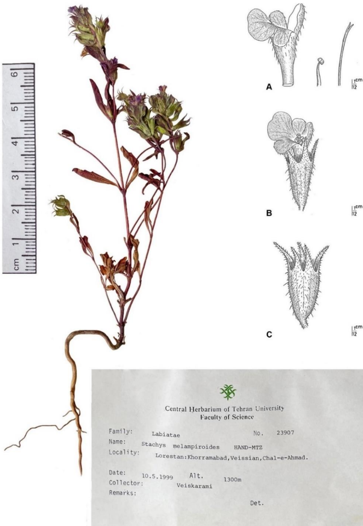
شکل ۱- نمونه گیاهه‌ای گونه S. melampyroides در گیاهکده مرکزی دانشگاه تهران. A. جام گل، B. گل، C. کاسه گل (Salmaki et al., 2012). Figure 1. The herbarium specimen of S. melampyroides in the Central Herbarium of Tehran University. A. corolla, B. flower, C. calyx (Salmaki et al., 2012).