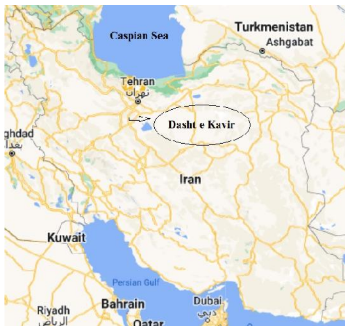
شکل ۱- نقشه مکان نمونه برداری. فلش مکان نمونه برداری را نشان می‌دهد.

دشت کویر یک اکوسیستم دست نخورده است که در این مطالعه، از ناحیه حاشیه غربی آن که در ۳۴ درجه و ۳۰ دقیقه عرض شمالی و ۵۱ درجه و ۵۲ دقیقه طول شرقی واقع شده است، نمونه برداری انجام شد (شکل ۱). شش نمونه مختلف از خاک‌های ریزوسفری گیاهان شورپسند strobilaceum Halocnemum (گتک)، rosmarinus Seidlitzia (مارونگ) و Halostachys belangeriana (سانتی متری ریشه، جمع‌آوری، روی یخ حمل و قبل از جداسازی در دمای ۴ درجه سانتیگراد در آزمایشگاه نگهداری شدند. محدوده pH برای نمونه‌ها ۷/۱ تا ۸ بود.