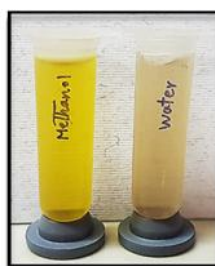
شکل ۲- عصاره‌های آبی (سمت راست) و متانولی (سمت چپ) از گل گیاه لاله هفت رنگ Figure 2. Water extract (right) and methanolic extract (left) of the flowers of T. biflora .