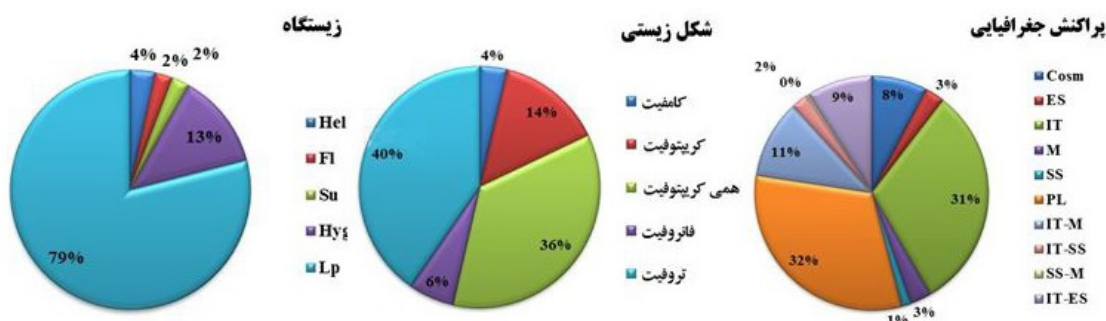
شکل ۲- نمودارهای وضعیت رویشی، شکل زیستی و پراکنش جغرافیایی گونه‌های گیاهی. Figure 2. Habitat, biological form and corology diagrams of plant species.

جدول ۲- فهرست گونه‌های گیاهی شناسایی شده در رویشگاه‌های آبی استان کرمانشاه. علائم اختصاری وضعیت رویشی: Hel= برآمده از آب، Hyd= آبی (Life form): Cha= کامفیت، Cr= کریبتوفیت، Su= غوطه‌ور، Hyg= رطوبت‌پسند، (LP) Land plant= گیاهان خشکی؛ شکل‌های زیستی (Life form): Cha= کامفیت، Cr= کریبتوفیت، Hem= همی کریبتوفیت، Pha= فانروفیت، Thr= تروفیت، پراکنش جغرافیایی (Chorotype): Cosm= جهان وطنی، ES= اروپا-سیبری، Hyr= هیرکانی، IT= ایرانی-تورانی، Z= زاگرسی، M= مدیترانه‌ای، PL= چند ناحیه‌ای، SS= صحاراسندی.