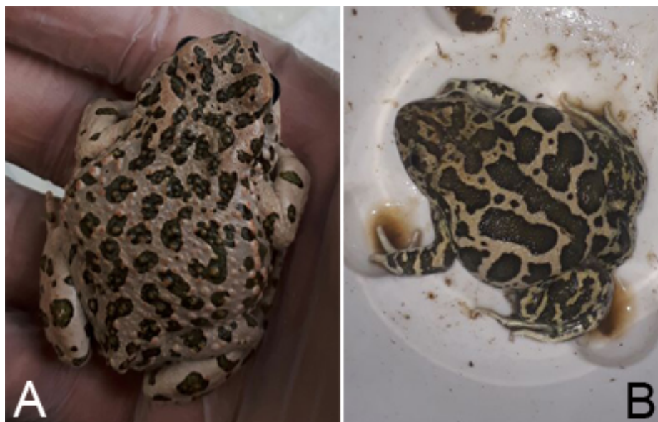
شکل ۱- تصاویر وزغ‌های بررسی شده در این مطالعه. A. وزغ سبز اروپایی ( Bufo viridis ). B. وزغ پایبلچه ای ( Pelobates syriacus ). Fig. 1. Photographs of toads investigated in this study. A. European green toad ( Bufo viridis ). B. Eastern spadefoot toad ( Pelobates syriacus ).