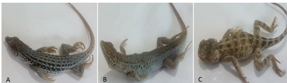
شکل ۱- تصاویر مارمولک‌های بررسی شده در این مطالعه A. Eremias monticola . B. Ophisops elegans . C. Trapelus lessonae Figure 1. Photographs of the reptilian species investigated. A. Eremias monticola . B. Ophisops elegans . C. Trapelus lessonae

جدول ۱- شاخص‌های همه گیرشناسی از انگل‌های هموکوکسیدیایی در سه گونه از مارمولک‌های استان مرکزی، ایران