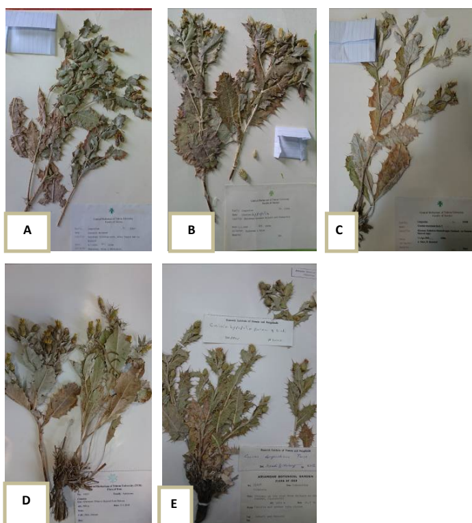
شکل ۴- تصاویر گونه‌های A: C. decipiens , B: C. hypopolia , C: C. renominata , D: C. stahlia , E: C. daryoushiana . Figure 4. Photos of the species: A: C. decipiens , B: C. hypopolia , C: C. renominata , D: C. stahlia , E: C. daryoushiana