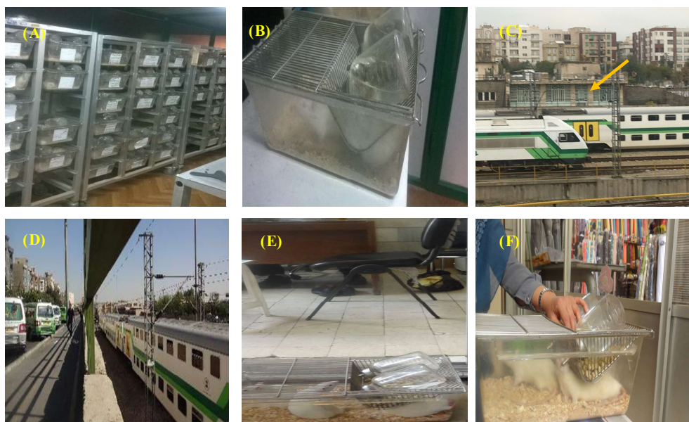
شکل ۱- A-B. محل نگهداری گروه کنترل. C. محل ساختمان اداری رز غربی (اطراف ایستگاه مترو صادقیه. D. خیابان رز غربی. E. گروه تجربی در ساختمان اداری رز غربی. F. گروه تجربی در بازار بزرگ تهران.

Fig. 1. A-B. Control groups. C. West Rose office building location (in the vicinity of Sadeghiyeh metro-station). D. West Rose Street. E. Experimental groups located in West Rose building. F. Experimental groups located in the Tehran Grand Bazaar.