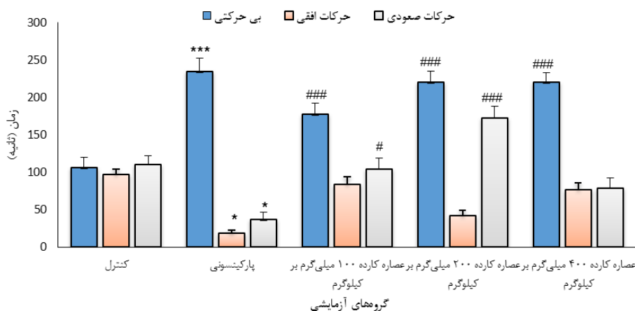
شکل ۱- تأثیر دوزهای مختلف عصاره کارده بر مدت زمان بی‌حرکتی، حرکت افقی و حرکت صعودی در آزمون شنای اجباری. *** نشان دهنده اختلاف معنی‌دار با کنترل در سطح p < 0.001 ، * نشان دهنده اختلاف معنی‌دار با کنترل در سطح p < 0.05 ، ### نشان دهنده اختلاف معنی‌دار با گروه پارکینسونی در سطح p < 0.001 ، # نشان دهنده اختلاف معنی‌دار با گروه پارکینسونی در سطح p < 0.05 .