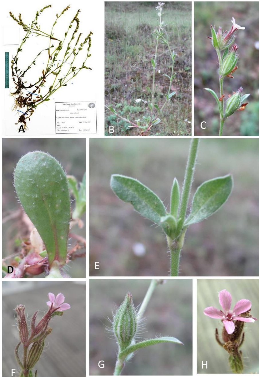
شکل ۲- Silene gallica : A: نمونه هرباریومی SPNH-2292، B: نمای طبیعی گیاه، C: گل آذین، D: برگ قاعده‌ای، E: برگ ساقه‌ای، F:

شکل کاسه در زمان گل، G: شکل کاسه در زمان میوه، H: نمای گل.