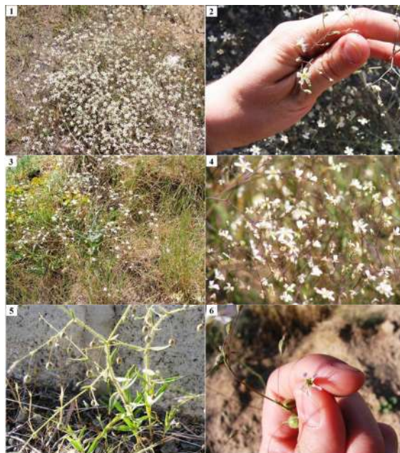
شکل ۳- (۱، ۲) Gypsophila polyclada var. polyclada . (۳، ۴) Gypsophila polyclada var. leioclada . (۵، ۶) Gypsophila pilosa var. pilosa .

Fig. 3. (1, 2) Gypsophila polyclada var. polyclada . (3, 4) Gypsophila polyclada var. leioclada . (5, 6) Gypsophila pilosa var. pilosa .