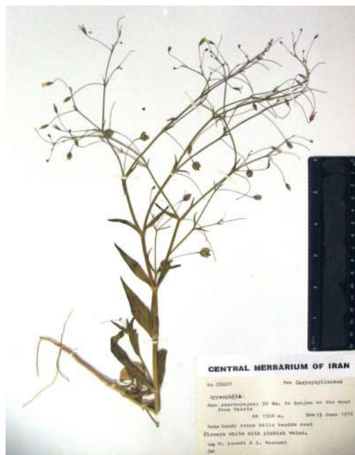
شکل ۴- Gypsophila pilosa var. glabra (هولو تایپ TARI).

Fig. 3. (1, 2) Gypsophila polyclada var. polyclada . (3, 4) Gypsophila polyclada var. leioclada . (5, 6) Gypsophila pilosa var. pilosa .