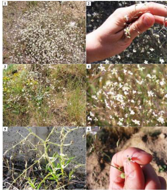
شکل ۳- (۱، ۲) Gypsophila polyclada var. polyclada . (۳، ۴) Gypsophila polyclada var. leioclada . (۵، ۶) Gypsophila pilosa var. pilosa .

Fig. 3. (1, 2) Gypsophila polyclada var. polyclada . (3, 4) Gypsophila polyclada var. leioclada . (5, 6) Gypsophila pilosa var. pilosa .