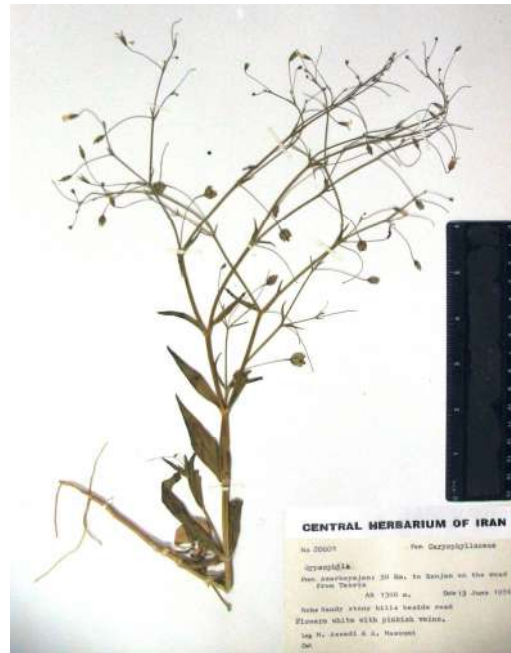
شکل ۴- Gypsophila pilosa var. glabra (هولو تایپ TARI).

Fig. 3. (1, 2) Gypsophila polyclada var. polyclada . (3, 4) Gypsophila polyclada var. leioclada . (5, 6) Gypsophila pilosa var. pilosa .