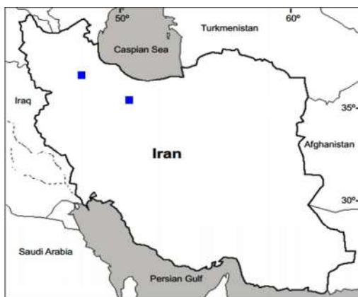
شکل ۶- پراکنش نمونه‌های مطالعه‌شده واریته G. pilosa var. glabra (■).

Fig. 5. Distribution of the studied specimens of two varieties, G. polyclada var. leioclada (■) and G. polyclada var. polyclada (●).