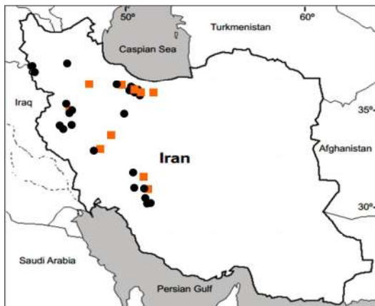
شکل ۵- پراکنش نمونه‌های مطالعه‌شده دو واریته G. polyclada var. leioclada (■) و G. polyclada var. polyclada (●).

Fig. 5. Distribution of the studied specimens of two varieties, G. polyclada var. leioclada (■) and G. polyclada var. polyclada (●).