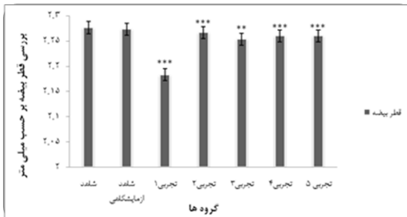
شکل ۱- مقایسه قطر بیضه‌ها در گروه‌های شاهد، شاهد آزمایشگاهی و گروه‌های تجربی ۱ تا ۵. (** p < 0.01 ), (***) p < 0.001 ).