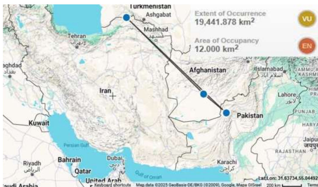
شکل ۳- نقشه وضعیت حفاظتی Astragalus suffalcatus Bunge Figure 3. Conservation status map of Astragalus suffalcatus Bunge

ارزیابی حفاظتی انجام‌شده نشان می‌دهد که این گونه از نظر سطح تحت اشغال (AOO) در رده در خطر انقراض (EN) و از نظر گستره پراکنش (EEO) در رده آسیب‌پذیر (VU) قرار می‌گیرد. این تفاوت بیانگر آن است که اگرچه پراکنش کلی گونه در سه کشور ایران، افغانستان و پاکستان نسبتاً وسیع است، اما جمعیت‌های آن احتمالاً به‌صورت لکه‌ای و با تراکم پایین حضور دارند. چنین الگویی در بسیاری از گونه‌های بومی و نیمه‌خشک سرده Astragalus مشاهده می‌شود که در زیستگاه‌های تخصصی و محدود استقرار یافته‌اند و در برابر تغییرات کاربری اراضی و تخریب زیستگاه حساس‌اند.