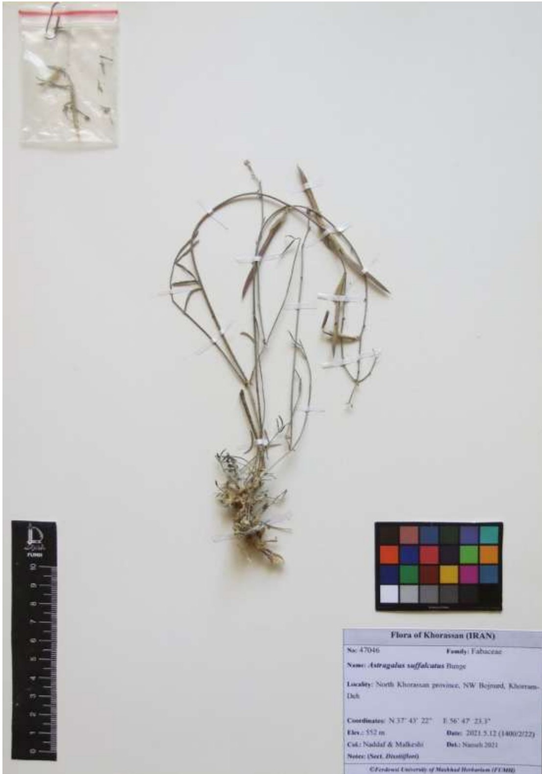
شکل ۱- تصویری از Astragalus suffalcatus Bunge Figure 1. Image of Astragalus suffalcatus Bunge