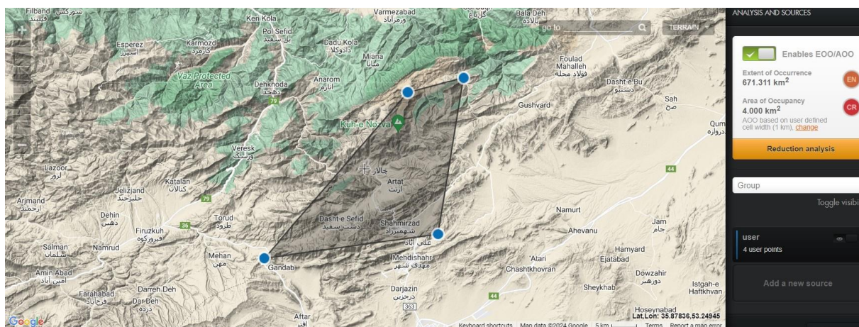
شکل ۴- محدوده حضور و سطح تحت اشغال گونه Seseli olivieri

تعداد پایه‌های بالغ و دانه‌رست S. olivieri در سه رویشگاه به ترتیب ۲۰۳ و ۲۷ شمارش شد. چرای دام و خشکسالی باعث تخریب جمعیت‌های این گونه و رویشگاه‌های آن شده است. با توجه به اینکه سطح تحت اشغال این گونه در جمعیت‌های