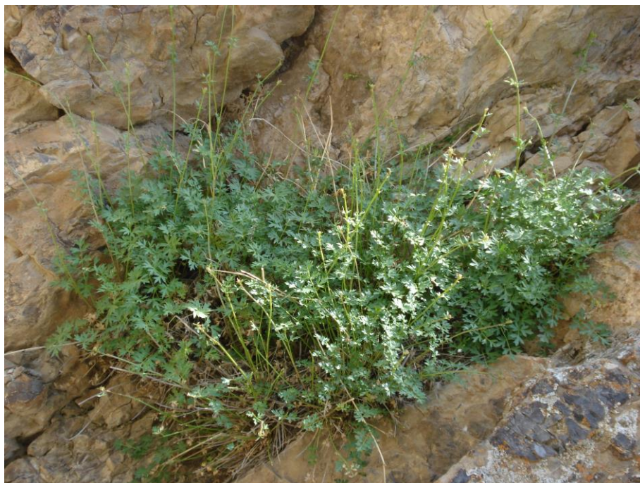
شکل ۱- S. olivieri در رویشگاه طبیعی.