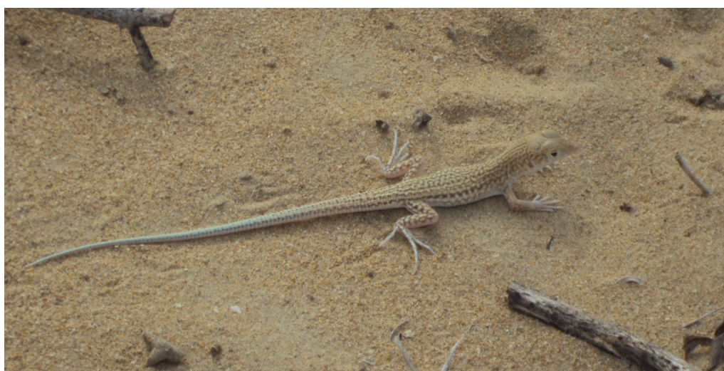
شکل ۱- نمایی از گونه مورد مطالعه A. blanfordi در زیستگاه طبیعی.

در این مطالعه ۴۴ نمونه از مارمولک‌های گونه A. blanfordi (شکل ۱)، در ایران متشکل از ۲۰ نمونه نر و ۲۴ نمونه ماده در جنوب ایران، استان هرمزگان مورد بررسی قرار گرفت. نمونه‌های