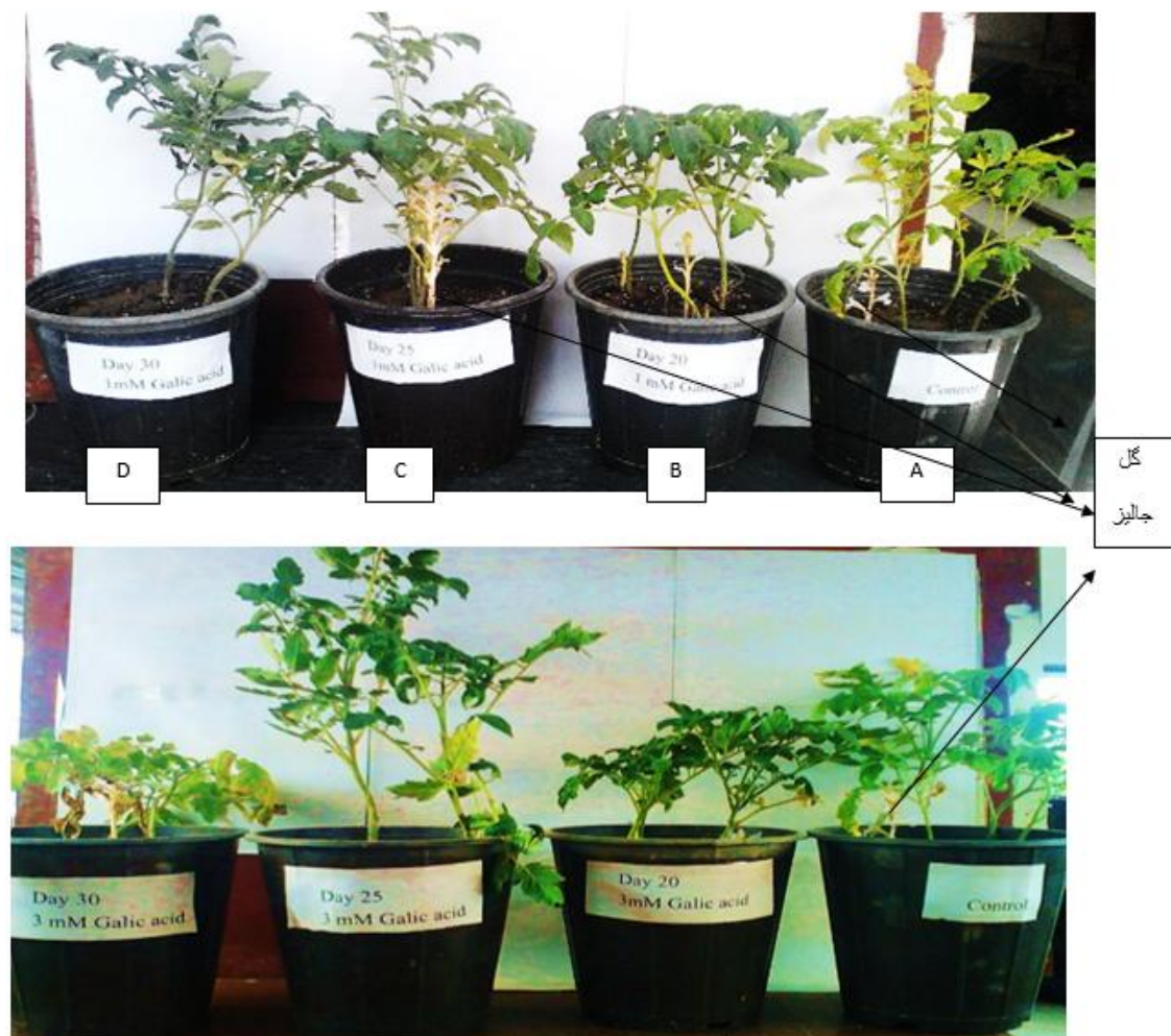
شکل ۱- اثر گالیک اسید (۱ و ۳ میلی‌مولار) در زمان‌های مختلف (۲۰، ۲۵ و ۳۰ روز) بر رشد گوجه‌فرنگی و گل جالیز. A. کنترل (فاقد گالیک اسید). B. تیمار گالیک اسید ۱ میلی‌مولار در روز ۲۰، دارای گل جالیز. C. تیمار گالیک اسید ۱ میلی‌مولار در روز ۲۵، دارای گل جالیز. D. تیمار گالیک اسید ۱ میلی‌مولار در روز ۳۰، فاقد گل جالیز. E. تیمار گالیک اسید ۳ میلی‌مولار در روز ۲۰، دارای گل جالیز. F. تیمار گالیک اسید ۳ میلی‌مولار در روز ۲۵، فاقد گل جالیز. G. تیمار گالیک اسید ۳ میلی‌مولار در روز ۳۰، فاقد گل جالیز.

Figure 1. Effect of gallic acid (1 and 3 mM) in different times (20, 25 and 30 days) on growth of tomato and broomrape. A. Control, gallic acid-free. B. 1 mM gallic acid treatment on day 20, with broomrape. C. 1 mM gallic acid treatment on day 25, with broomrape. D. 1 mM gallic acid treatment on day 30, no broomrape. E. 3 mM gallic acid treatment on day 20, with broomrape. F. 3 mM gallic acid treatment on day 25, no broomrape. G. 3 mM gallic acid treatment on day 30, no broomrape.