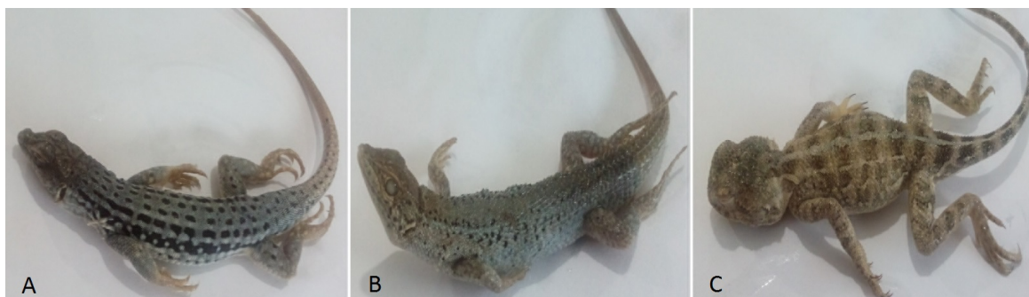
شکل ۱- تصاویر مارمولک‌های بررسی شده در این مطالعه A. Eremias monticola . B. Ophisops elegans . C. Trapelus lessonae Figure 1. Photographs of the reptilian species investigated. A. Eremias monticola . B. Ophisops elegans . C. Trapelus lessonae

جدول ۱- شاخص‌های همه گیرشناسی از انگل‌های هموکوکسیدیایی در سه گونه از مارمولک‌های استان مرکزی، ایران