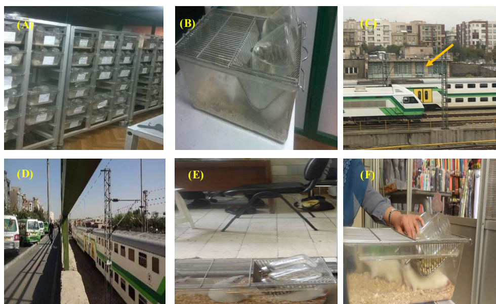
شکل ۱- A-B. محل نگهداری گروه کنترل. C. محل ساختمان اداری رز غربی (اطراف ایستگاه مترو صادقیه. D. خیابان رز غربی. E. گروه تجربی در ساختمان اداری رز غربی. F. گروه تجربی در بازار بزرگ تهران.

Fig. 1. A-B. Control groups. C. West Rose office building location (in the vicinity of Sadeghiyeh metro-station). D. West Rose Street. E. Experimental groups located in West Rose building. F. Experimental groups located in the Tehran Grand Bazaar.