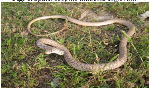
شکل ۸- مار دستی.