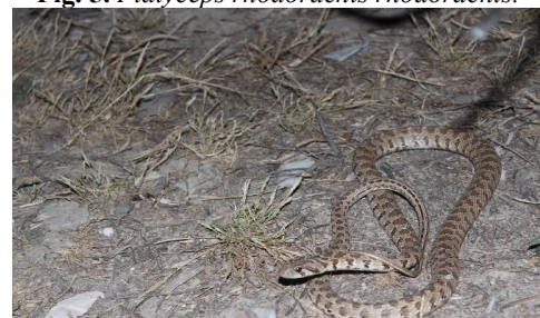
شکل ۷- مار پلنگی.