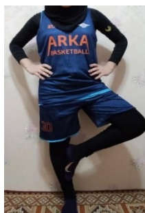
شکل ۳. ارزیابی تعادل ایستا

جهت ارزیابی تعادل ایستا از تست فلامینگو (ایستادن روی پای برتر با چشمان بسته) با پایایی درون آزمونگر خوب (۰/۹۹ تا ۰/۸۷) و پایایی باز آزمایشی ضعیف تا خوب (۱ تا ۰/۵۹) استفاده شد. در این آزمون شرکت کننده بر روی پای ترجیحی خود ایستاده و دست ها را در ناحیه کمر قرار داد. سپس پای دیگر به اندازه تقریباً ۱۰ سانتیمتر از سطح مورد نظر (زمین) جدا شده و با ارائه محرک فرد، چشمان خود را باید ببندد. نمره تعادل ایستای این فرد با مقدار زمانی که پای خود را بالا نگه داشته و یا تعادل فرد دچار اختلال نشده به دست آمد (شکل ۳) (۲۵).