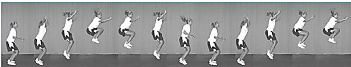
شکل ۱. تست پرش تاک (۳۳)

در این پژوهش قد آزمودنی‌ها با قدسنج و وزن آن‌ها از ترازوی دیجیتال استفاده شد. جهت ارزیابی نقص تنه از تست پرش تاک با پایایی بین آزمونگر (۹۳/۱) و پایایی درون آزمونگر (۸۷/۱) استفاده شد. در این آزمون فرد با پاهای باز به اندازه عرض شانه می‌ایستد و به صورت عمودی شروع به پرش می‌کند و زانوهای خود را تا حد امکان بالا می‌آورد. در بالاترین نقطه پرش، ران‌ها موازی با زمین قرار می‌گیرند. بلافاصله بعد از فرود، فرد باید پرش تاک بعدی را شروع کند. آزمودنی پرش تاک را به مدت ۱۰ ثانیه به صورت متوالی تکرار می‌کند. برای بهبود دقت ارزیابی از دو دوربین فیلمبرداری در دو نمای قدامی و جانبی استفاده شد، دوربین‌ها با فاصله سه متری از آزمودنی‌ها تنظیم شدند تا تصویر به صورت درشت‌نمایی شده برای بررسی در اختیار پژوهشگر قرار بگیرد، پس از انجام آزمون، برای بررسی سکانس‌های پرش، از نرم افزار کینوا استفاده شد فردی که قادر نباشد در محل شروع پرش خود فرود بیاید، در نقطه اوج پرش ران‌های موازی با زمین قرار نگیرد و پرش هایش در طول ۱۰ ثانیه با وقفه انجام گیرد، به عنوان فرد دارای نقص تنه در نظر گرفته شد (۱۸). هر آزمودنی سه بار با آزمون پرش ارزیابی شد و میانگین امتیازات ورزشکاران ثبت شد تا افراد مبتلا به نقص عصبی - عضلانی و به خصوص نقص تنه شناسایی شوند (شکل ۱) (۱۸).