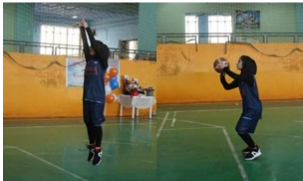
شکل ۵. ارزیابی مهارت اختصاصی