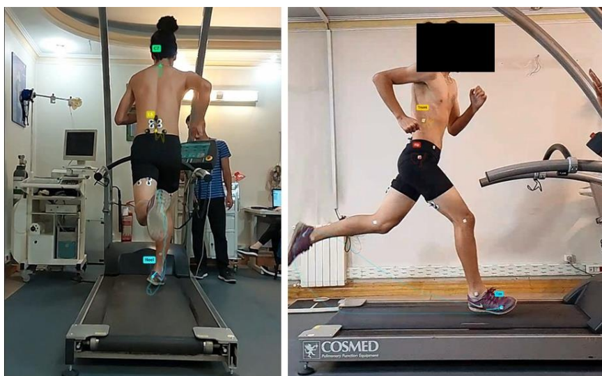
شکل ۲. آزمون دویدن

جهت بررسی کینماتیک دویدن در سرعت بالا از ارزیابی کینماتیکی دو بعدی توسط دوربین سرعت بالا ساخت شرکت سونی IMX514 (برای متغیرهای خم شدن توراسیک و خم شدن جانبی توراسیک) و همچنین ارزیابی سه بعدی کینماتیک با استفاده از شتاب سنج (ارزیابی دامنه تیلت قدامی لگن)، استفاده شد. مارکرها بر روی دنده دوازدهم، خار خاصره قدامی فوقانی، برجستگی بزرگ ران، کندیل خارجی زانو، قوزک خارجی مچ پا، استخوان پنجم کف پا، پاشنه، مهره هفتم گردنی و مهره پنجم کمری قرار گرفتند. پس از مارکگذاری آزمودنی ها و قرارگیری مناسب محل دوربین ها، با توجه به قد آزمودنی ها، آزمون دویدن بر روی تردمیل انجام گرفت. با توجه به این که آسیب همسترینگ در سرعت های بالای دویدن رخ می دهد، سرعت مورداستفاده در این آزمون ۲۰ کیلومتر بر ساعت و بدون شیب بود (شکل ۲) (۲۴). ابتدا جهت گرم کردن، ورزشکار ۱۰ دقیقه بر روی سرعت های کمتر شروع به راه رفتن و نرم دویدن می کرد. وقتی که به سرعت ۲۰ کیلومتر بر ساعت رسید به تعداد ۳۰ قدم در این سرعت می دوید. داده های مورد ارزیابی در قدم های بین ۱۵ تا ۲۵ ضبط شدند. همچنین این اندازه گیری ها ۳ بار انجام گرفت و میانگین داده ها ثبت شد. جهت جلوگیری از خستگی، آزمودنی بین هر بار دویدن ۵ دقیقه استراحت می کرد.