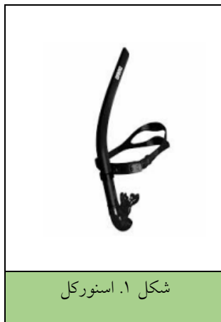
شکل ۱. اسنورکل