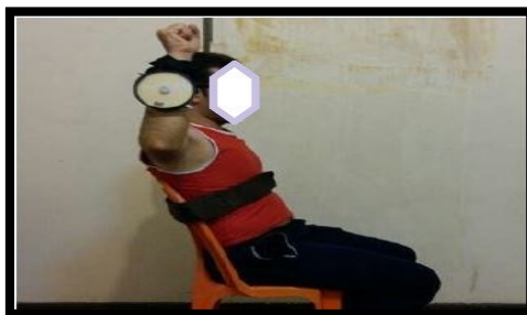
شکل ۳. وضعیت قرارگیری فلکسومتر جهت ارزیابی حس عمقی چرخش خارجی و داخلی (برگرفته از کار پژوهشی صاحب‌الزمانی و همکاران ۱۳۹۷)