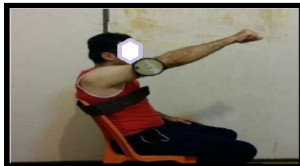
شکل ۲. وضعیت قرارگیری فلکسومتر جهت ارزیابی حس عمقی دور شدن و خم شدن (برگرفته از کار پژوهشی صاحب‌الزمانی و همکاران ۱۳۹۷)