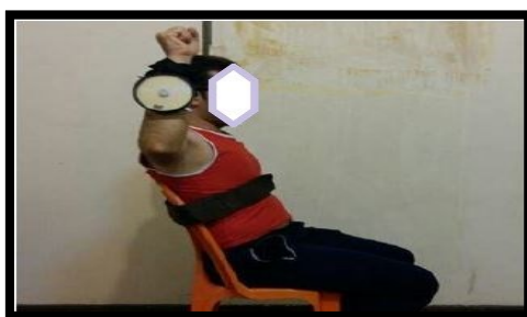
شکل ۳. وضعیت قرارگیری فلکسومتر جهت ارزیابی حس عمقی چرخش خارجی و داخلی (برگرفته از کار پژوهشی صاحب‌الزمانی و همکاران ۱۳۹۷)