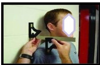
شکل ۷. اندازه‌گیری شانه روبه‌جلو (برگرفته از کار پژوهشی معصومی و همکاران ۲۰۱۱)

اندازه‌گیری شانه به جلو: برای تعیین کمیت وضعیت شانه به جلو (شانه گرد) از دستگاه چهار گوش دوگانه (طبق مدل 420 EM) استفاده شد. روایی و اعتبار چهار گوش ارزیابی شانه به جلو به صورت تخمین، بیان شده و محققین گزارش کردند که روش استفاده از چارگوش دوگانه همبستگی متوسطی با اندازه‌گیری رادیوگرافی داشته و از اعتبار بالایی ( ICC=0/89 ) برخوردار است (۱۱). در این روش از آزمودنی خواسته شد پوشش بالاتنه خود را درآورده و روبروی آزمونگر بایستد. بعدازآن زائده آخرومی سمت چپ و راست به عنوان نقطه‌ی مرجع علامت‌گذاری شد. سپس آزمودنی در جلوی دیوار ایستاده و ده بار درجای نظامی انجام داده، شانه‌هایش را سه بار به طرف جلو و عقب گرد کرده و سپس پنج بار سرش را جلو و عقب می‌برد. این توالی حرکت برای ایجاد یک وضعیت ایستادن نرمال انجام شد. آزمودنی بعدازآن به طرف عقب به سمت دیوار حرکت کرد تا وقتی که باسنش دیوار را لمس کند در این وضعیت باقی می‌ماند تا اندازه‌گیری کامل شود. بعدازآن فاصله بین دیوار و سر قدامی زائده آخرومی با استفاده از چهارگوش دوگانه به سانتی‌متر ثبت می‌شد، در ضمن اندازه‌گیری در هر شانه سه بار تکرار شده و میانگین آن‌ها در دست برتر (دست برتر آزمودنی‌ها قبل از آزمون با پرتاب توپ معلوم شده بود) استفاده می‌شد (۱۱، ۱۶).