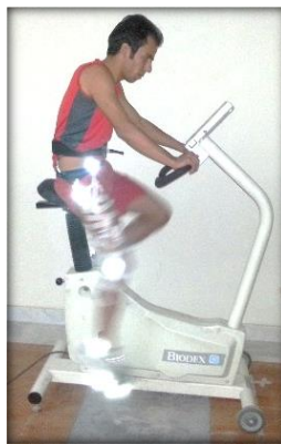
تصویر ۱: نحوه اجرای پروتکل رکاب زدن توسط آزمودنی

پس از نصب مارکرها روی بدن، آزمودنی برای اجرای پروتکل رکاب زدن آماده شد. نحوه اجرای رکاب زدن روی دوچرخه ایزوکیتیک برای آزمودنی توضیح و آموزش داده شد. هر آزمودنی ابتدا روی زین دوچرخه قرار می‌گرفت و ارتفاع زین برای وی تنظیم می‌شد. ارتفاع زین برای تمام آزمودنی‌ها به نحوی تنظیم می‌شد که در زمان قرار گرفتن رکاب در پایین‌ترین موقعیت، اندام تحتانی آزمودنی به طور کامل در حالت اکستنشن قرار گیرد. از آزمودنی‌ها خواسته شد هنگام انجام پروتکل رکاب زدن در شدت کار ۷۰ دور بر دقیقه رکاب زده و زمانی که به شدت کار ثابت ۷۰ دور بر دقیقه می‌رسید، اطلاعات کینماتیکی از اندام تحتانی به مدت ۳۰ ثانیه ثبت می‌شد. آزمودنی‌ها در طی مدت زمان ۳۰ ثانیه حدود ۳۳ چرخه کامل رکاب زدن را اجرا می‌کردند که از بین آنها تعداد ۳۰ چرخه متوالی برای انجام تحلیل‌های تغییرپذیری استخراج شد و مورد استفاده قرار گرفت. تصویر ۱ نحوه قرار گرفتن آزمودنی روی دوچرخه ایزوکیتیک را نشان می‌دهد.