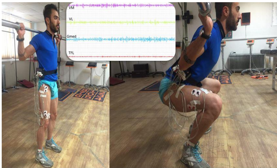
شکل ۲. انجام حرکت اسکات با زوایای مختلف مفصل هیپ

داده‌های حاصل از ثبت فعالیت الکترومایوگرافی عضلات به مدت هشت ثانیه بدون تفکیک فاز کانستریک و اکستریک حرکت اسکات با فرکانس نمونه‌برداری ۱۰۰۰ هرتز و با پهنای باند ۱۰ تا ۴۵۰ Hz فیلتر (band-pass filtered) شد و با استفاده از شیوه ریشه میانگین مجذور (RMS) با پنجره‌ی زمانی صد میلی‌ثانیه محاسبه گردید. به منظور نرمالیز کردن داده‌ها، برای هر آزمودنی داده‌های پردازش شده RMS برای هر عضله به مقدار RMS به دست آمده از حداکثر فعالیت عضله (MVIC) تقسیم گردید و سپس برای ایجاد درصدی از مقدار حداکثر فعالیت عضله، عدد حاصل در عدد ۱۰۰ ضرب گردید؛ بنابراین میزان فعالیت هر عضله بر اساس درصدی از حداکثر مقدار فعالیت عضله در هر مرحله بیان شد. همچنین برای محاسبه نسبت فعالیت Gmed/TFL ، RMS عضله Gmed به RMS عضله TFL تقسیم شد و برای محاسبه نسبت فعالیت VM/VL ، RMS عضله VM به RMS عضله VL تقسیم شد. برای تحلیل سیگنال‌های خام از نرم‌افزار LabVIEW ۱ و برای تحلیل آماری داده‌ها از آزمون فریدمن و ویلکاکسون استفاده شد.