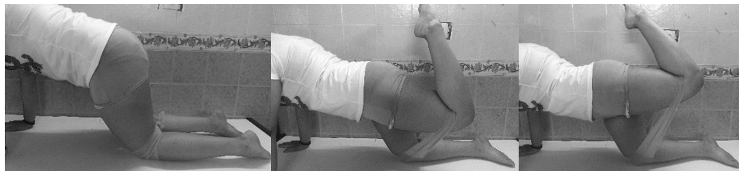
شکل ۳ نحوه انجام تمرین آزمودنی‌های گروه تجربی (از چپ به راست: ابتدا، میانه و انتهای حرکت باز کردن ران با مقاومت کش تمرین)

بیش از حد ران در برابر مقاومت کش تمرین) و برای ویژه تر کردن تمرین به صورت برونگرا، ۳ ثانیه انقباض برونگرا (حرکت خم کردن ران (بازگشت به وضعیت شروع حرکت)) طبق تصویر شماره ۳ انتخاب شد. اگرچه آزمون بر روی پای برتر افراد صورت می گرفت، به دلایل اخلاقی و به جهت برهم نزدن تعادل عضلانی بدن در دو سمت، تمرینات تقویتی به صورت متقارن برای هر دو پا انجام گرفت.